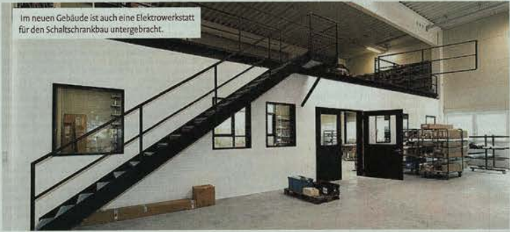
Im neuen Gebäude ist auch eine Elektrowerkstatt für den Schaltschrankbau untergebracht.