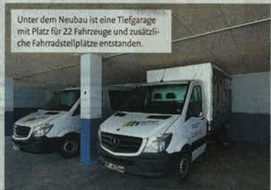
Unter dem Neubau ist eine Tiefgarage mit Platz für 22 Fahrzeuge und zusätzliche Fahrradstellplätze entstanden.

Weil qualifizierte Mitarbeiter schwer zu bekommen sind, setzt das Unternehmen auf eigene Auszubildende. „Der Vorteil ist, sie wissen,